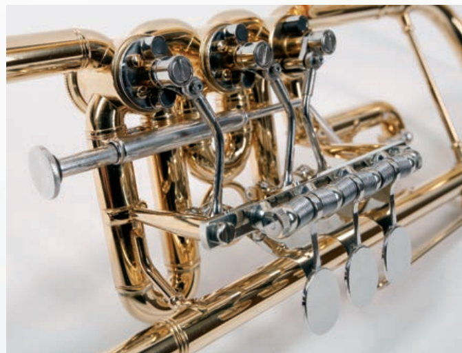
Konische Neusilbermaschine von Zirnbauer

Zunächst habe ich die brass Austria angespielt, was mich spontan fasziniert hat. Sie bietet eine leichte Ansprache wie auf einer Perinettrompete. Der Klang ist sehr frei und groß. Besonders beachtlich ist das strahlende Timbre, das nicht aufdringlich wirkt, sondern dem Ton einen schönen Glanz