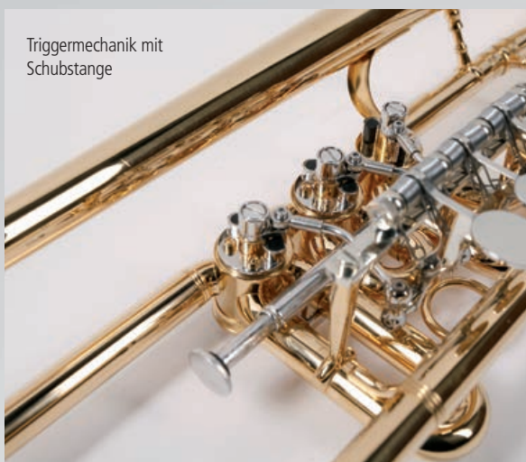
Triggermechanik mit Schubstange