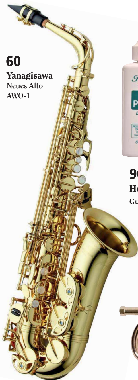
Yanagisawa Neues Alto AWO-1