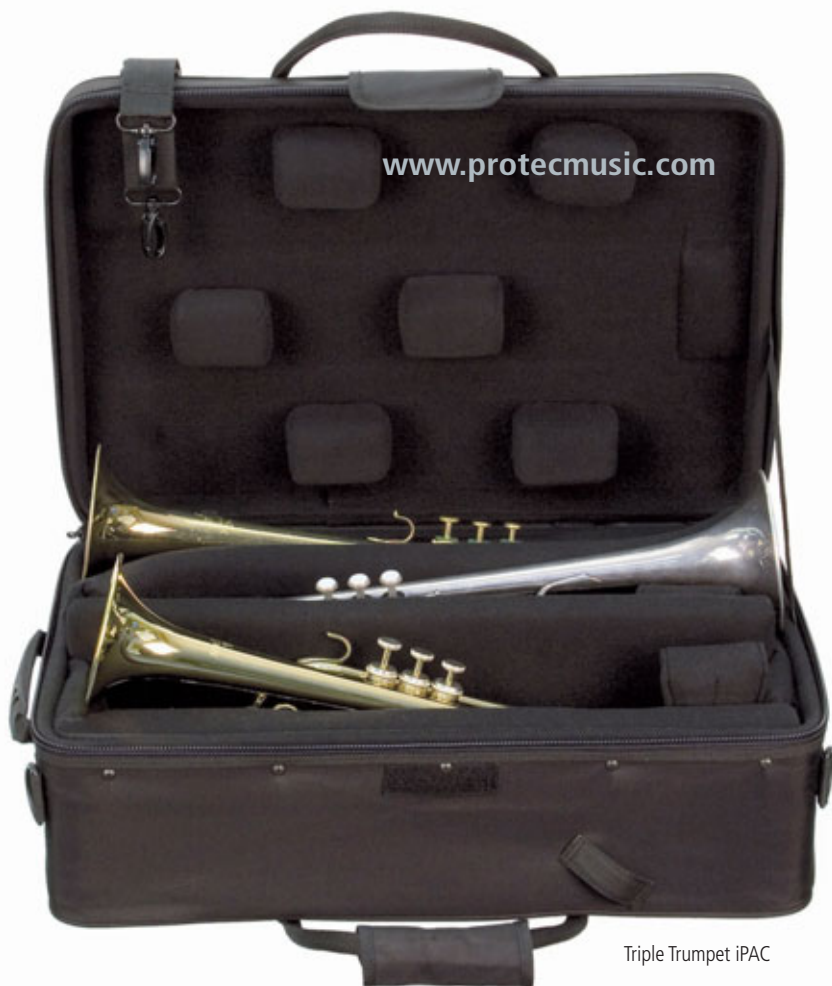
Triple Trumpet iPAC