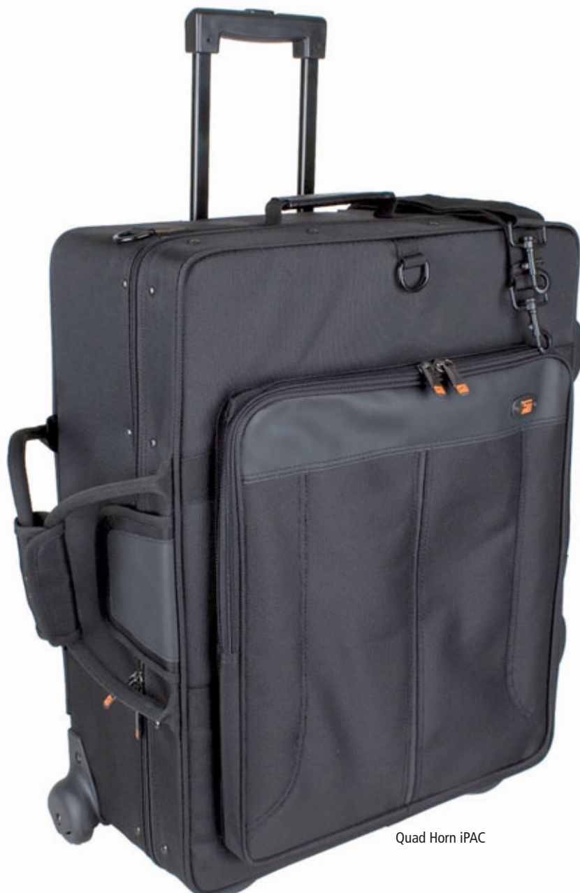
Quad Horn iPAC

Das Gig Bag hat mich in der Praxis vollkommen überzeugt. Allein das Öffnen und Schließen durch die mit einem Band verbundenen beiden Reißverschlüsse ist schon komfortabel. Überdies überzeugt das Bag durch sein geringes Gewicht, verbunden mit großer Flexibilität und guter handwerklicher Verarbeitung. Insbesondere der UVP von 157,50 Euro macht das Gig Bag unter Berücksichtigung des gesamten Lieferumfangs und der in dem Bereich einmaligen 5-Jahres-Garantie aus meiner Sicht zu einem hervorragenden Angebot.