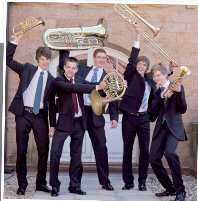
Bei einigen Konzerten dabei: LJO Brass

Dass sich das Rennquintett auch über scheinbare instrumentale Grenzen wagt, belegen diese Aufnahmen: Auf