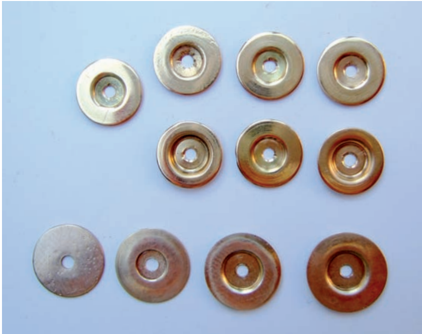
Kieser Polsterscheiben in verschiedenen Goldlegierungen

Bereich Polster mit drei unterschiedlichen Härten an. Bekannt sind die Polster von Straubinger und seinen Nachahmern, bei denen das Polster in einer festen „Schüssel“ aus Alu oder Kunststoff liegt. Bei der Verwendung von hartem Polster-Material kann es Probleme geben, wenn die Tonloch-ränder nicht absolut plan sind, was bei gezogenen Tonlöchern häufiger vorkommt als bei aufgelöteten. An dem Thema „Polster“ forschen viele Hersteller; hier hält sich Christoph Kieser weitgehend heraus und beschränkt sich auf die Beratung.