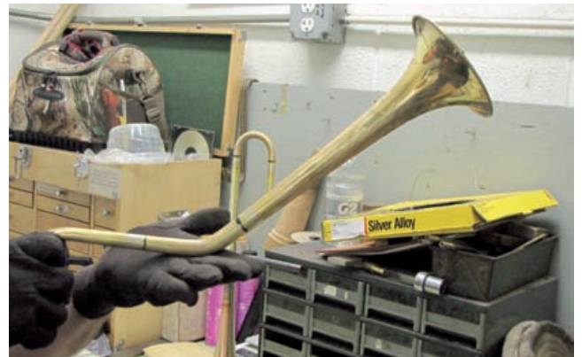
... wie das Dizzy Gillespie Modell