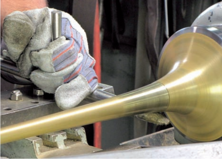
Abdrehen auf der Drehbank mit einem Stahlprücker