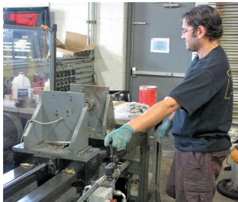
Ziehen der Mundrohre