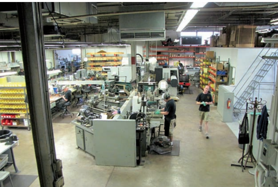
Ausblick mit Überblick: Die Sicht aus dem Büro des Produktionsleiters