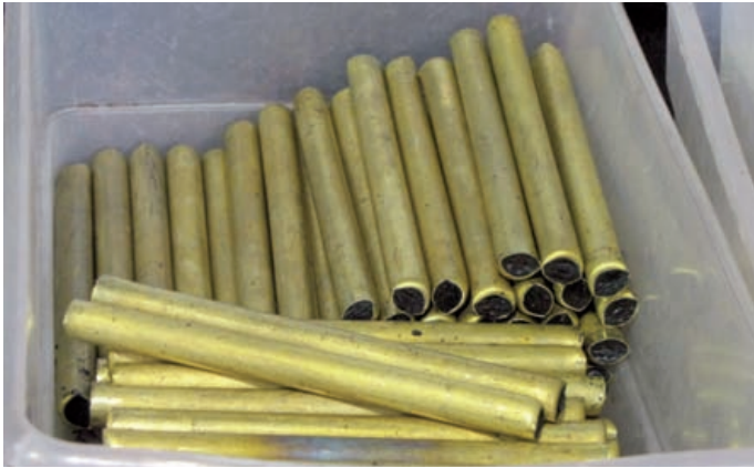
Pechartige Masse verhindert Faltenbildung