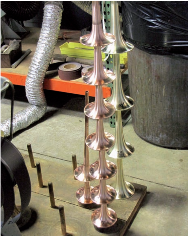
Nach dem Einlegen des Runddrahts: Fertige Schallstücke

Anschluss daran der Rand des Schallbeckers mithilfe eines Werkzeugs etwas angehoben und ein Messingrunddraht eingelegt.