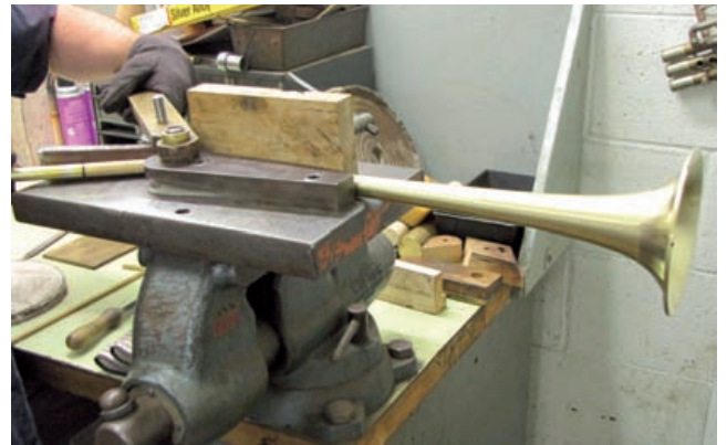
Biegeapparat für den Schall ermöglicht jegliche Sonderformen...

Danach wird unter Einsatz einer Schablone die Schallstückbiegung kontrolliert und das Schallstück ausgerichtet. Mit dem Biegeapparat können auch sämtliche Sonderformen wie beispielsweise ein Dizzy-Gillespie-Schallstück gebogen werden.