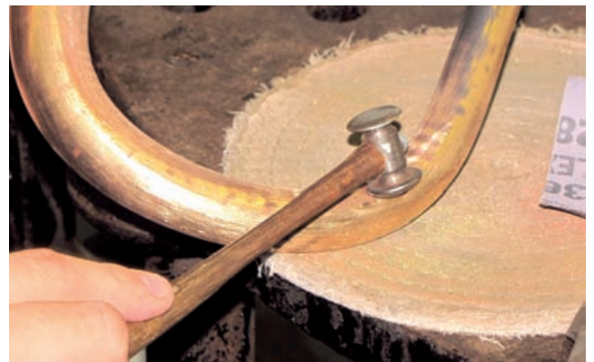
Auspochen beim Flügelhornschall