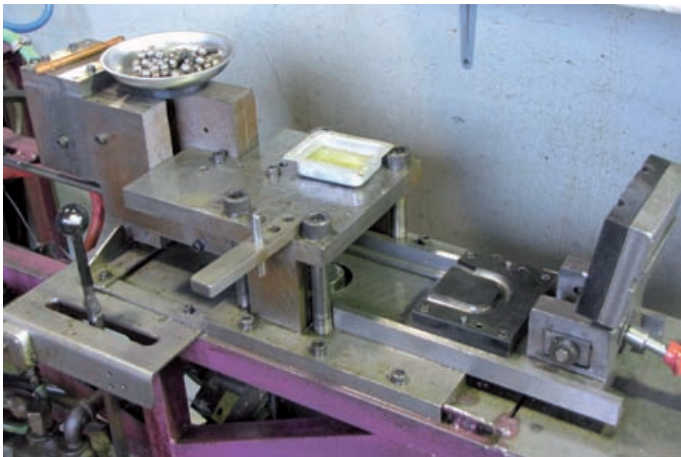
In die Biegeschablone geschoben: So entstehen die Stimmzüge!