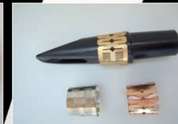
FLEXITONE BLATTZWINGE VON BORGANI