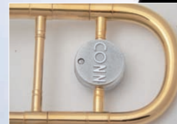
CONN 6H POSAUNENKLASSIKER