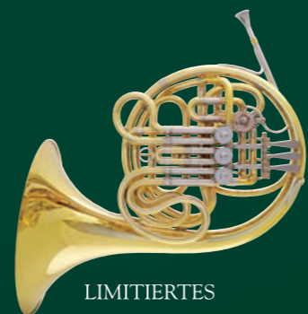
LIMITIERTES JUBILÄUMSMODELL F/B-DOPPELHORN 103

Zum 100jährigen Jubiläum der Patenterteilung für das Doppelhorn mit 6-Wege-Umschaltventil hat Gebr. Alexander das Original von 1909, basierend auf alten Plänen, aber mit aktueller Technik, in einer exklusiv limitierten Auflage von 25 Stück nachgebaut. Neben unzähligen Details, die in aufwändiger Handarbeit entstanden sind, wurde beim Nachbau des Originalinstruments bei der gesamten Planung besonderer Wert auf eine überragende Stimmung, Intonation und Spielbarkeit des Doppelhorns gelegt.