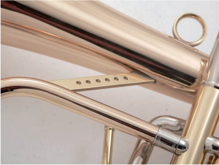
Individuell: Becher- ...