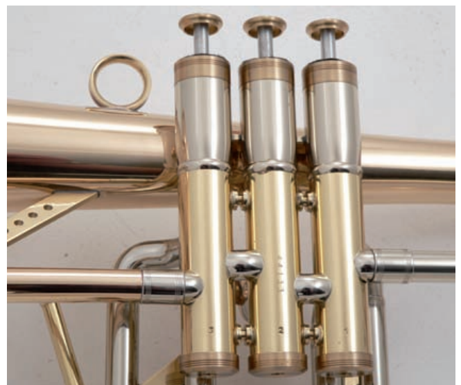
Präzision auf höchstem Niveau

Eigentlich könnte man dieses Instrument die ganze Zeit nur ansehen. Goldmessing, Neusilber, eine perfekte Maschine – das muss man genießen. Doch die Konkurrenz fährt mächtige Geschütze auf, jetzt muss sich die Kochkunst vom Niederrhein beweisen! Also Mundstück drauf und los. Handling perfekt – oder fast perfekt. Der Triggerhebel ist für kleine Hände zu weit von der Maschine positioniert und nur schwer zu erreichen. Doch keine Sorge, hier könnte Radermacher schnell nachwürzen. In seiner Werkstatt werden alle machbaren Wünsche erfüllt; Hebel, Haken und Ringe individuell zu positionieren gehört hier