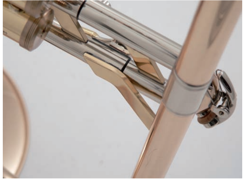
... und Korpusstütze