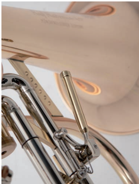
Nicht immer passend: Triggerhebel

Mit dem Drei-Zylinder ist ihm ein echtes Kunstwerk gelungen. Ihm und Bauerfeind, der nach wie vor für beste deutsche Qualität beim Perinet-Maschinenbau steht. Messingbüchsen, die im oberen Bereich mit Neusilberhülsen